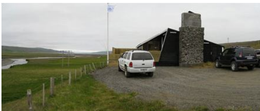
Veidihus Lodge (Hruta Lodge)

В домиках для гостей всего 4 спальни (двухместное размещение с двумя одноместными кроватями), гостиная с камином, кухня, оборудованная всем необходимым, просторная веранда. Размещение предоставляется на основе self-catering. В нескольких минутах езды от лоджа находятся кафе, где можно поесть, заправочная станция, небольшой магазин. Услуги all inclusive (питание полный пансион) - по запросу.