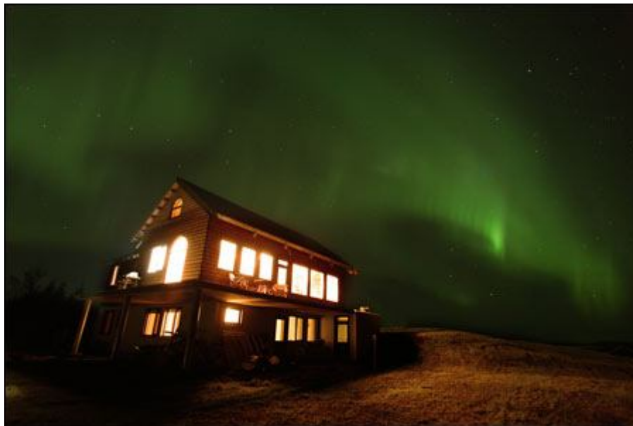
Tungulækur luxury lodge

На первый взгляд узкое и небольшое водное пространство может показаться не совсем удачным местом для рыбалки, однако оно состоит из множества заводей и небольших водоемов, что в сочетании с местом слияния двух рек - искусственной и ледниковой, делает здешнюю рыбалку как нельзя более удачной. По меньшей мере, вплоть до последнего рыболовного сезона 2009 г не было получено ни одного нарекания от какой-либо из групп путешественников. Каждому был гарантированно обеспечен улов и удовольствие от предвкушения добычи.