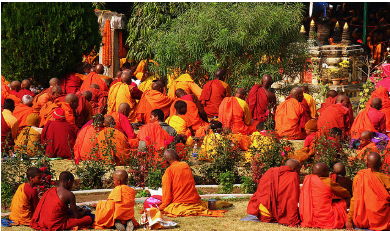
Монахи в Бодх-Гая, Индия