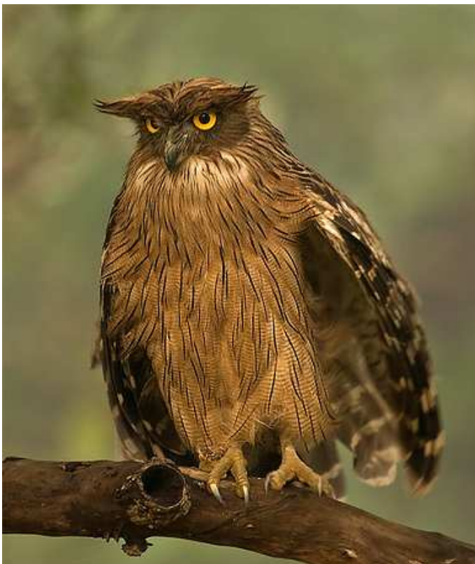
Бурый рыбный филин ( Bubo zeylonensis )

К хищникам, обитающим на территории парка, следует отнести также диких собак. Их отличают большие «круглые» уши и красновато-коричневая шерсть на спине и по бокам с вкраплениями белых пятен и разводов имбирного оттенка на брюхе, груди и шее. Дикие собаки невероятно общительны, они образуют большие стаи и подчиняются строгой иерархии внутри семейства. Из всех членов выделяется одна пара, ответственная за производство потомства, в то время как остальные помогают воспитывать и вскармливать молодых отпрысков.