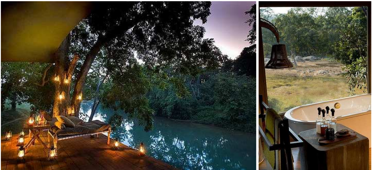
Banjaar Tola Kanha Tented Camp

Размещение: 4 ночи в сафари-лагере Banjaar Tola Kanha Tented Camp , расположенном на реке Банжаар. В стоимость входит сафари (по 2 выезда ежедневно).