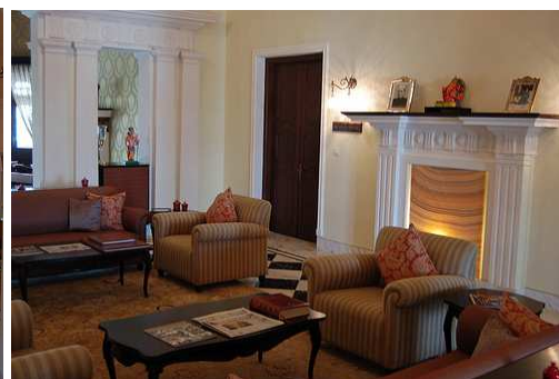
Отель Taj Nadesar Palace