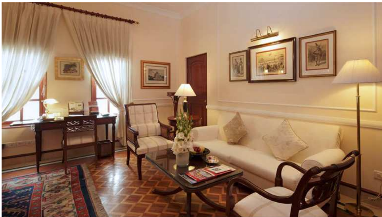
Номер «Grand Heritage», The Imperial New Delhi Hotel

2355 Размещение в отеле Imperial Hotel, в номере Grand Heritage room.