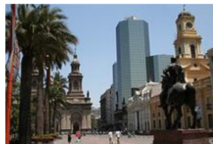
Santiago's Plaza de Armas