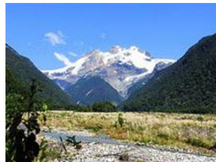
Национальный парк Висенте Перес Росалес