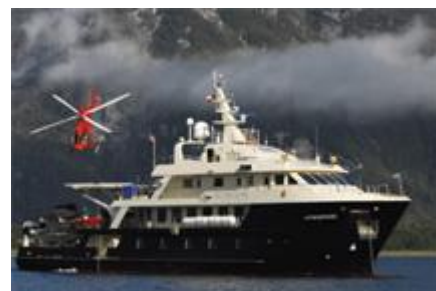
Яхта Nomads of the Seas