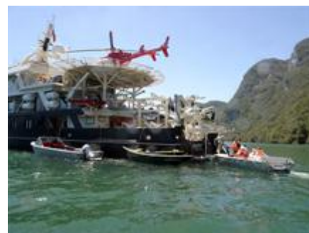
Высадка на катера