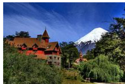
Отель Petrohue, на фоне вулкана Осорно, Край Озер, Чили