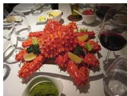
Ужин на борту