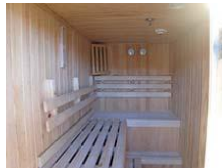
Сауна на борту

Зодиаки: резиновые лодки, оборудованы двигателем Tohatsu, мощность – 18 лс, как нельзя лучше подходят для исследования новых рыболовных мест. Очень легкие, что позволяет брать их с собой даже на борт вертолета Bell 407.