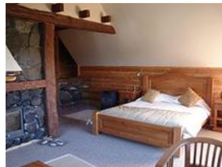
Номер в отеле Petrohue