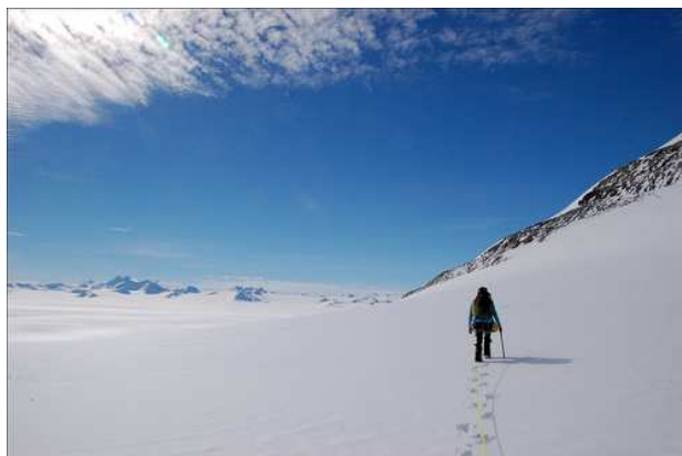
Прогулка в окрестностях Union Glacier Camp