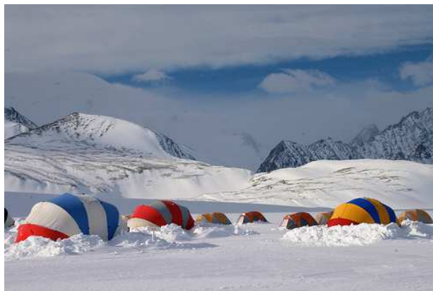
Жилые модули (двухконтурные палатки)