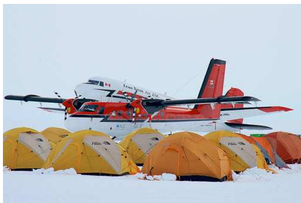
Basler (самолет на котором вы летите на ЮП)