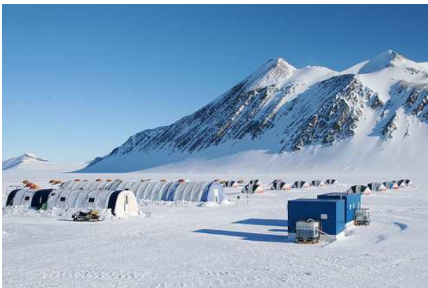
Лагерь Union Glacier Camp