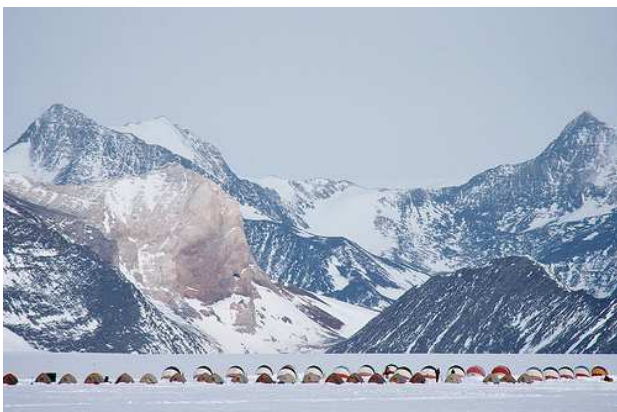
Union Glacier Camp