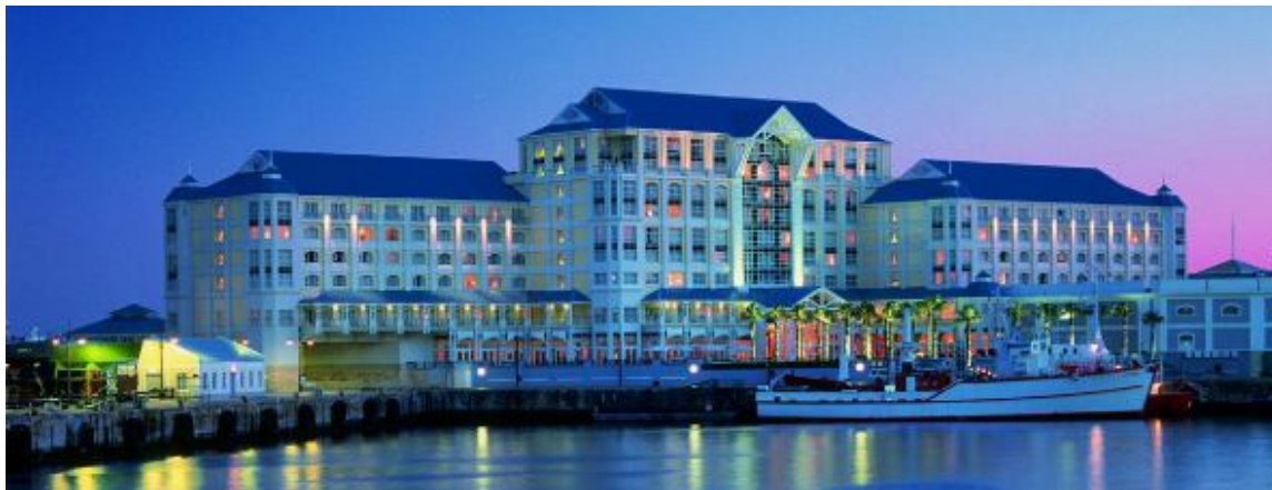
The Table Bay Hotel