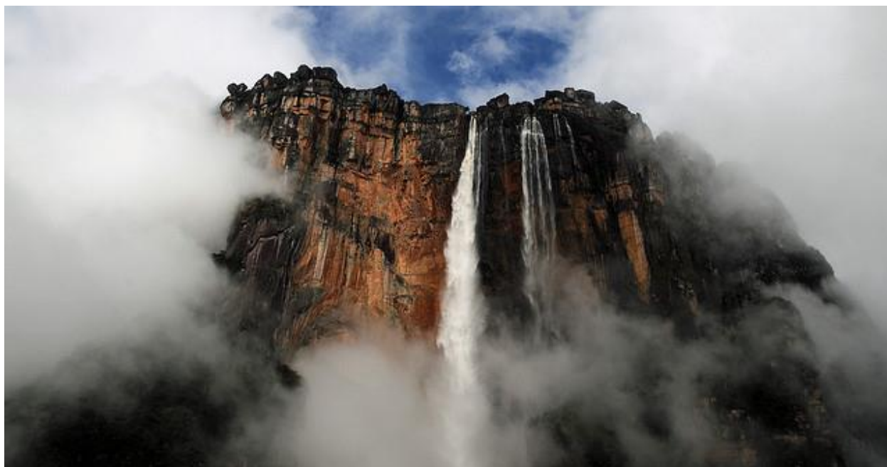
Salto Angel, Ауян Тепуи

Внутренний перелет в национальный парк Канайма, где находится самый высокий водопад в мире - водопад Анхель (979 м), в 16 раз превышающий высоту Ниагарских водопадов. 2 дня в парке Канайма позволят вдоволь насладиться красотой окружающей природы на пешеходных тропах.