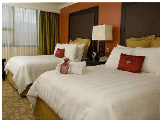
Hotel Crowne Plaza Corobici 5*, Deluxe room