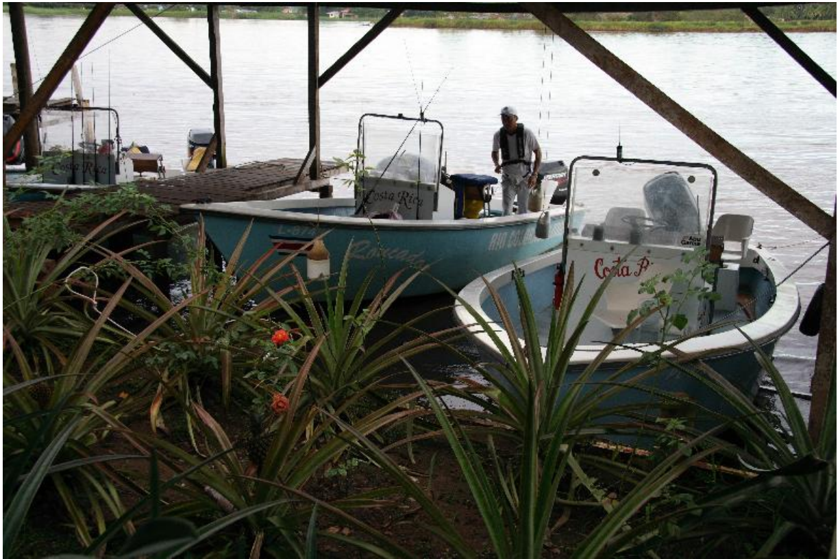
Рыболовные катера Rio Colorado Lodge

Внимание: Время начала/окончания рыбалки может оговариваться на месте и немного меняться. Продолжительность рыбалки не может превышать 8 часов в день. Все лодки Rio Colorado Lodge должны возвращаться не позднее 17:30.