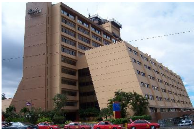
Hotel Crowne Plaza Corobici 5*, Сан-Хосе

что все экскурсии в Сан-Хосе начинаются рано, поэтому в случае, если у Вас возникнет желание успеть все посмотреть, необходимо запланировать возвращение в Сан-Хосе до 09:00 и, соответственно, более ранний чартерный вылет. Это можно обсудить заранее в Rio Colorado Lodge.