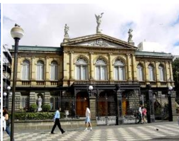
Сан-Хосе, Пласа-де-ла-Культура. Национальный театр