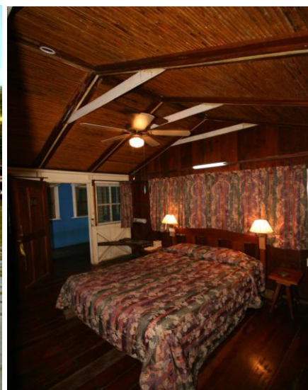
Номера Rio Colorado Lodge

“Rio Colorado Lodge – один из лучших рыболовных лоджей в Коста-Рике, в каких мне когда-либо приходилось бывать. Определенно, рыбалка в Rio Colorado Lodge – лучший отдых всей моей жизни!”