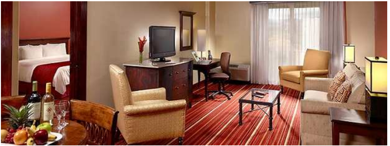
Courtyard by Marriott San Jose Escazu, One bedroom Suite.

Размещение: Courtyard by Marriott San Jose Escazu , One bedroom Suite.