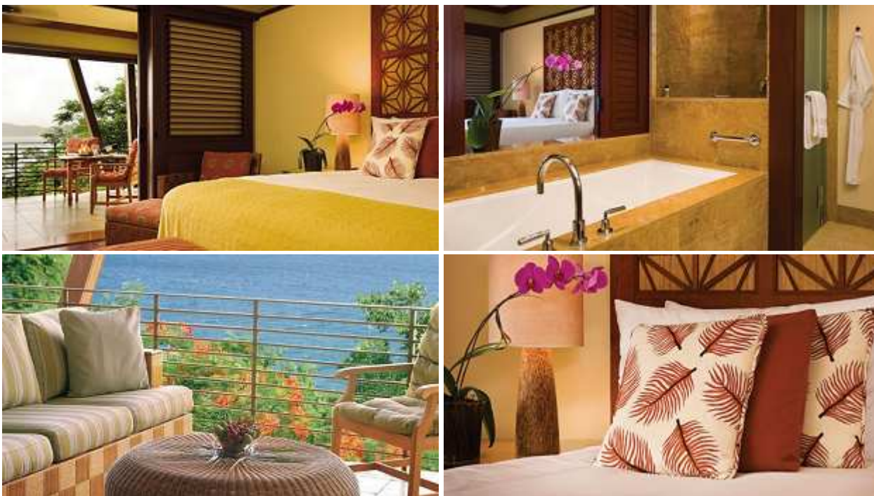
Cielo room / Premium room, площадь 56 м 2

Brisa room / Deluxe room (56 кв.м): терраса с гостиной зоной, спальня (с кроватью "king-size" или двумя отдельными кроватями), гостиная зона, облицованная мрамором ванная комната с ванной и душевой кабинкой. Вид на сад. Номера расположены на 2 и 3 этажах.