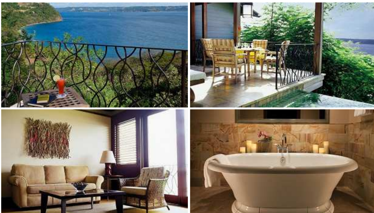
Canopy suite 1-bedroom with plunge pool (со своим бассейном), площадь 112 м 2

Canopy suite 1-bedroom with plunge pool (ex. Suite 1-bedroom) (112 кв.м): персональный бассейн, спальня (с кроватью "king-size"), отдельная гостиная, облицованная мрамором ванная комната с ванной и душевой кабинкой, гостевая туалетная комната. Вид океан и тропические заросли.