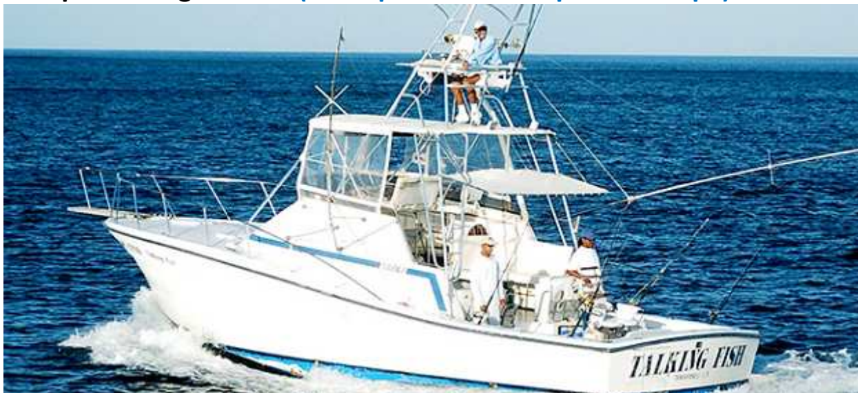
Talking Fish 38'

Talking Fish is our 38' Topaz Express, powered by twin Detroit turbo diesels. This superbly set up boat is fully equipped with Penn International, Shimano and Accurate tackle, depth sounder and GPS. Comfortably seating 6 persons in the shade, it features a large cockpit with full size fighting chair and double spreader outriggers. The cabin has a V-berth and a private head with shower.