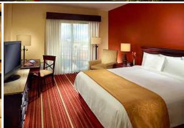
Courtyard by Marriott San Jose Escazu, Restaurant / Standard room.

Размещение: Courtyard by Marriott San Jose Escazu , Standard room, 1 SGL + 2 DBLs.