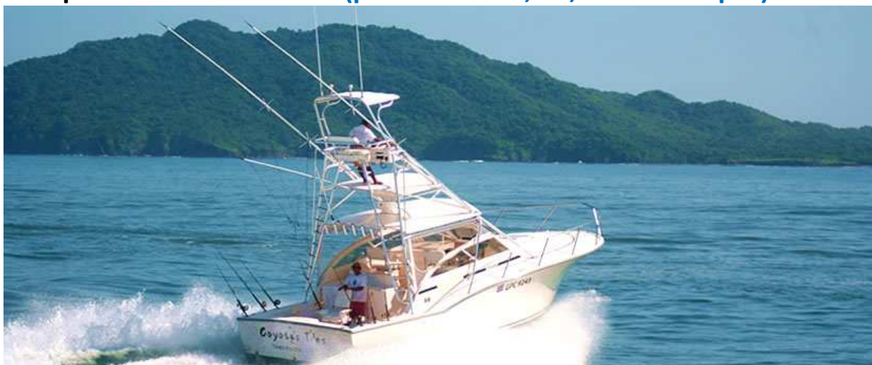
Carolina Classic 35'

Катер обладает всеми необходимыми характеристиками для проведения качественной, безопасной и комфортной рыбалки на Тихоокеанском побережье Коста-Рики.