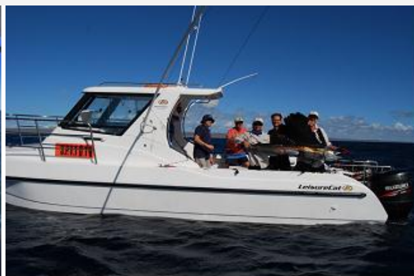
Leisure Cat 8000 Sportsfisher