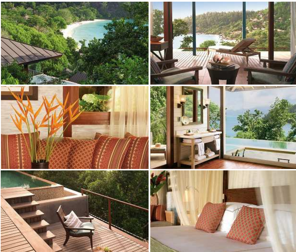
Hilltop Ocean View Villa

Размещение: Four Seasons Seychelles Resort