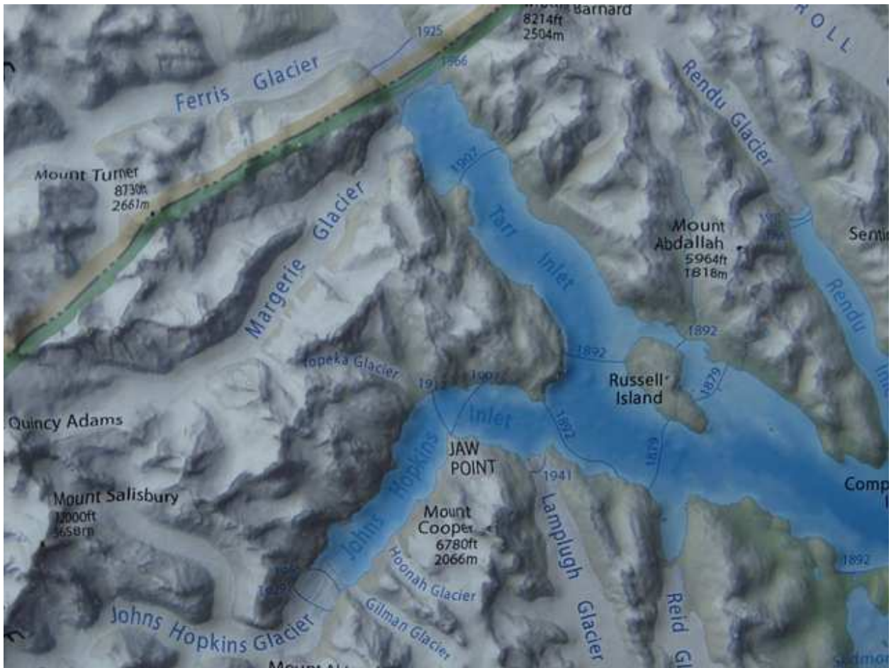
Карта национального парка Глейшер-Бей