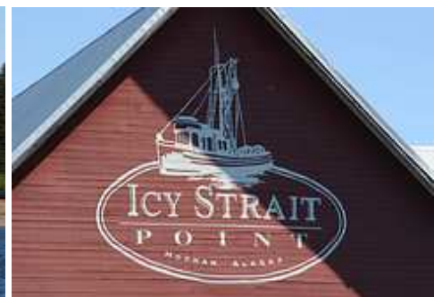
Айси Стрэйт Поинт

Айси Стрэйт (Icy Strait) – пролив в юго-восточной части штата Аляска между островом Чичагова и материковой частью континента. Айси Стрэйт