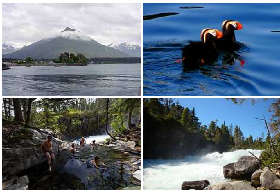
Остров Баранова / тупики / горячие источники острова / водопад

На сегодня у нас нет какой-то определенной программы. Мы совершим круиз вокруг живописного водопада вдоль береговой линии острова Чичагова. Наслаждайтесь великолепными просторными ландшафтами и пейзажами дикого края Аляски. Ваши гиды расскажут Вам о таких местах, которые Вы не найдете в туристических справочниках, ибо они известны лишь местным жителям и не являются частью избитых маршрутов. Ближе к вечеру мы, возможно, войдем в залив Рэд Блафф, где Вы сможете возобновить экскурсии на лодках и каяках в поисках морских выдр и медведей перед тем, как отплыть к следующему пункту по маршруту – острову Баранова.