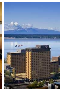
Junior Suite, Captain Cook Hotel, Anchorage, USA

Размещение: Captain Cook Hotel , Junior Suite DBL, BB